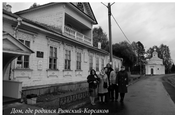
Дом, где родился Римский-Корсаков