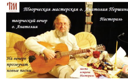
написать на tvormast@mail.ru