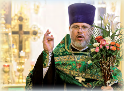
Вербное воскресенье в нашем храме – эту и другие новости вы увидите на страницах 2-3