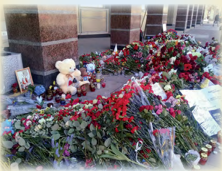
Живые отклики на трагические события – в материале на 15-ой стр.