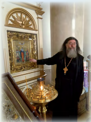
Незабываемая экскурсия состоялась у творческого объединения «Образ». Материал на стр. 10