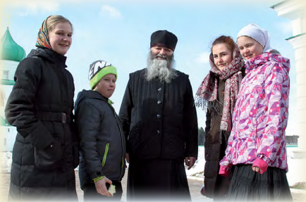
Как юные краеведы потрудились в Александро-Свирском монастыре, вы узнаете, прочитав их заметки на стр. 4