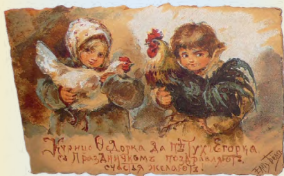
Послание из прошлого – историко-краеведческая статья И. Кузиной на стр. 13